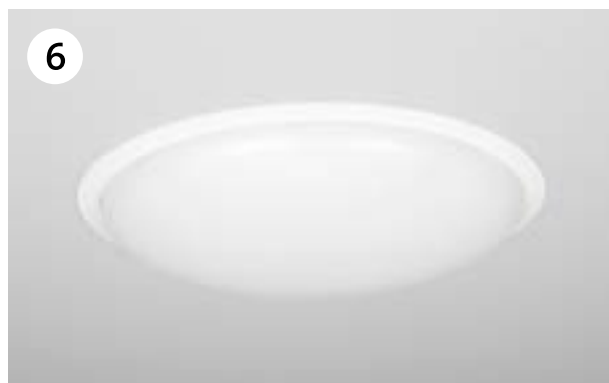
De installatie is gereed. U kunt nu het licht aan doen.