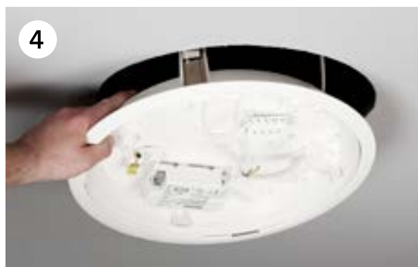
Leg de kabel in het armatuur en maak de drie borgveren los. Het armatuur wordt in de opening geïnstalleerd.