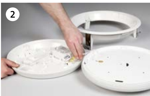
Haal de verlichtingsunit en frame uit elkaar.