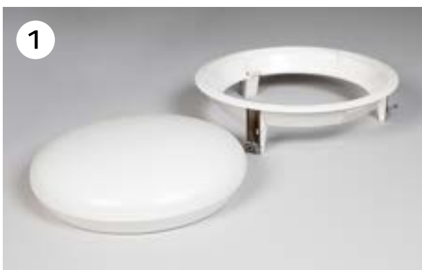
Inbouwring en armatuur, die bestaat uit LED-module, kap en frame.

Een armatuur dat in grote aantallen wordt gemonteerd, en vaak in lastige ruimtes, vraagt om een efficiënte installatie. Discovery Evo is één van de snelste die op de markt verkrijgbaar is. Een innovatieve montageoplossing met frame en inbouwset zorgen voor een makkelijk te hanteren verlichtingsunit. LED-module en kap zijn samengevoegd, wat de installatie flexibel en veilig maakt. De installateur kan deze verlichtingsunit met gerust hart wegleggen terwijl het frame wordt gemonteerd.