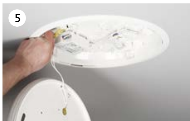
Bevestig de veiligheidskabel en sluit de snelkoppeling aan. Monteer de verlichtingsunit in het frame met een bajonetsluiting.