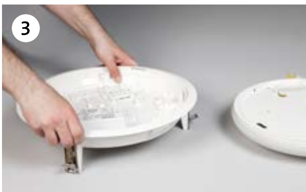
Plaats het frame in de inbouwring en zet het met een klik vast.